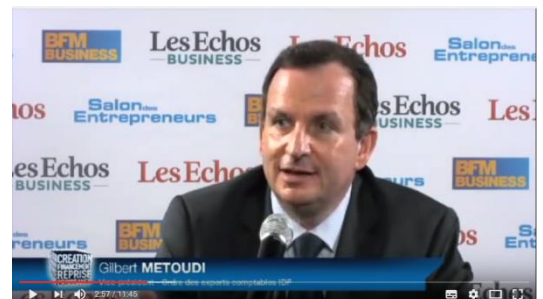
Construire un business plan : les 10 points essentiels.