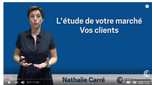
Astuces pour faire l'étude de votre marché

Vidéo : https://www.youtube.com/watch?v=-9jLpOZyjLw 11min35