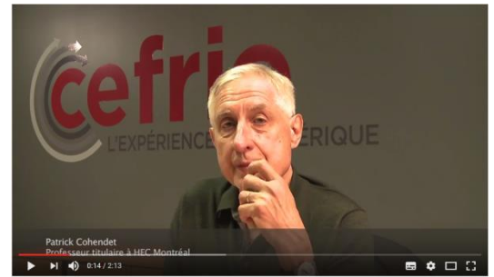
Apple et LEGO comme exemples de nouveaux modèles d'affaires